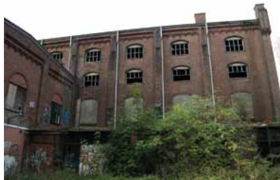
Voormalig fabriekscomplex in Bergen op Zoom.

Het gemoderniseerde monumentenbeleid betekent een verandering in het denken over de omgang met cultureel erfgoed. Een goede samenwerking tussen de verschillende beleidsterreinen is daarvoor noodzakelijk. Enerzijds zal de monumentenambtenaar actief mee moeten denken over gebiedsgerichte ontwikkelingen. Anderzijds moet het vertalen van cultuurhistorische waarden in nieuwe plannen ook voor ontwerpers en ontwikkelaars verankerd raken in hun denk- en werkwijze. Om elkaar op het juiste moment te spreken en elkaar te voorzien van bruikbare informatie, is niet altijd eenvoudig. Het maken van procesafspraken voor de samenwerking van de verschillende afdelingen en ambtenaren is daarom belangrijk. Een voorwaarde is dat alle beleidssectoren die bij de ontwikkeling van nieuwe ruimtelijke plannen zijn betrokken, bekend zijn met de cultuurhistorische kwaliteiten van de gemeente.