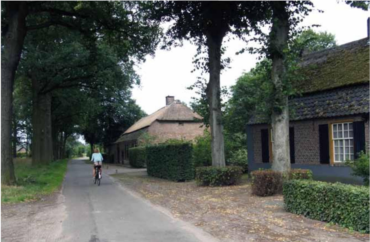
Historisch buurtschap Loon in Waalre.

stemde de Tweede Kamer in met de beleidsbrief Modernisering Monumentenzorg (MoMo). Eén van de pijlers van het gemoderniseerd monumentenbeleid is het meewegen van cultuurhistorische belangen in de ruimtelijke ordening. Het nieuwe beleid heeft een integrale benadering en focust op een gebiedsgerichte bescherming waarbij ook de omgeving van monumenten wordt beschermd.