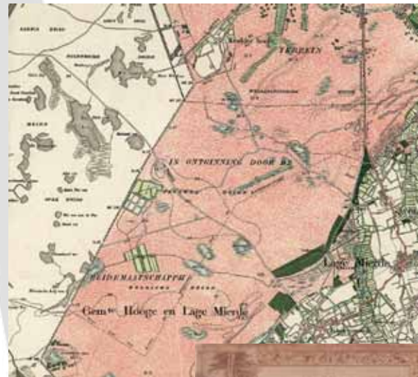
Topografische militaire kaart, ca. 1900.