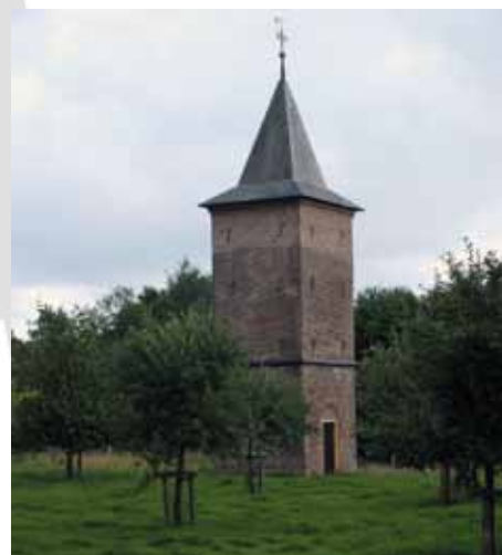
Duiventoren in Casteren. Behalve het monumentale object, is ook het omliggende landschap van belang.

Om cultureel erfgoed daadwerkelijk onderdeel te laten worden van ruimtelijke processen is het belangrijk om dit vast te leggen in ruimtelijk beleid. Een erfgoedambitie, waarin wordt vastgelegd hoe er met cultuurhistorie wordt omgegaan en hoe waarden worden geïmplementeerd, wordt bij voorkeur vastgelegd in een structuurvisie. Een structuurvisie vormt het algemene beleids- en toetsingskader voor ruimtelijke ontwikkelingen op de lange termijn. Een vraag bij het opstellen van de structuurvisie is hoe cultuurhistorische onderzoeken worden geïmplementeerd in het beleid. Een erfgoednota is geschikt om het erfgoedbeleid nader uit te werken en vorm te geven, alsook de doelstellingen en uitgangspunten van het gemeentelijk erfgoedbeleid vast te leggen.