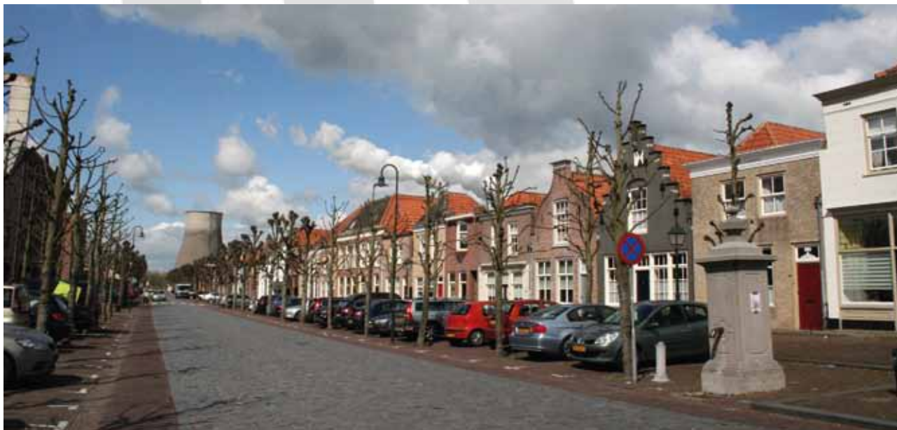
Venestraat in Geertruidenberg.