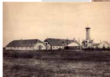
Ontginningscomplex "De Utrecht".