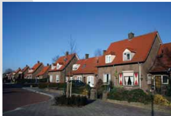
Wederopbouwwijk in Heesch.

Cultuurhistorische onderzoeken en waardenkaarten dienen door de gemeenteraad te worden vastgesteld. Na vaststelling hebben de cultuurhistorische onderzoeken beleidsstatus en bieden ze een toetsingskader om cultuurhistorie mee te wegen bij de beoordeling van ruimtelijke plannen. Cultuurhistorische waardenkaarten en verkenningen maken een snelle toetsing van ruimtelijke plannen aan cultuurhistorische waarden mogelijk. Zonder vaststelling hebben de onderzoeken geen status, en is er geen goede en 'harde' afweging mogelijk.