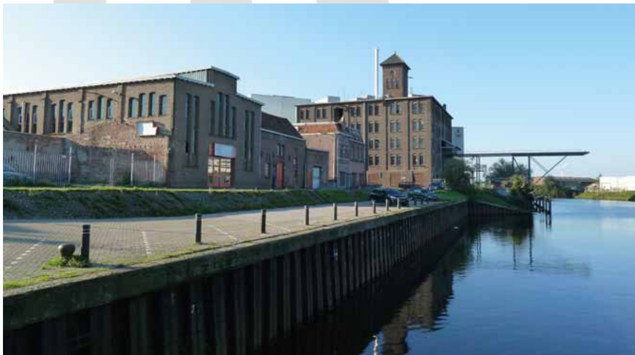
Historisch fabriekscomplex in 's-Hertogenbosch.

Om de gemeentelijke cultuurhistorische elementen te kunnen behouden en tijdig te kunnen reageren op ontwikkelingen, moeten gemeenten beleid ontwikkelen op het terrein van gebiedsgerichte