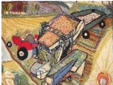
Wandkleed, detail suikerbietenooft

In het Vlas- en Suikermuseum werden twee groepen rondgeleid. In de museumboerderij kregen de deelnemers aan de excursie eerst een inzicht in het kleinschalige en oorspronkelijke proces van het produceren van vlas en suiker. Daarna werd een bezoek gebracht aan de, in volop campagne draaiende Suikerfabriek. Daar vindt de verwerking van biet naar suiker in een gesloten proces plaats en krijgt men nauwelijks inzicht in de vervaardiging van het eindproduct.