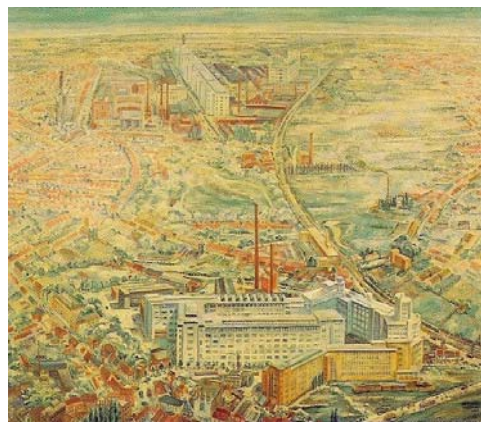
A. Lubbers 1949, Gezicht op Eindhoven met de Philipsbedrijven

Zij vertellen over de emoties die gepaard gingen met het verdwijnen van de fabriek. De BrIE heeft met de auteurs meegedacht hoe dit boek onder de aandacht van een groter publiek te kunnen brengen.