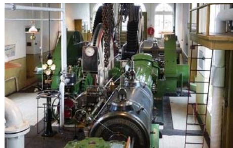
Stoomgemaal Halfweg zijn beiden onderdeel van de Holland Route