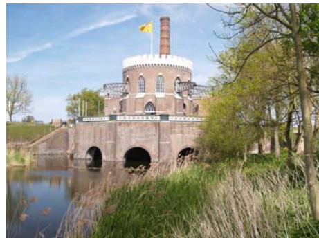
Stoomgemaal De Cruquius en

In 2011 zijn met deze stichting contacten gelegd die er toe geleid hebben dat in februari jl. de eerste serieuze besprekingen zijn opgestart om een Brabant-Route netwerk te realiseren.