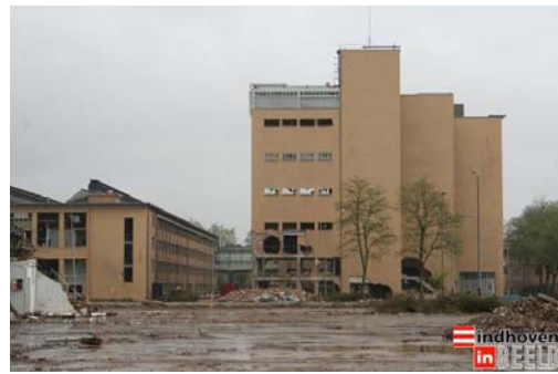
Afbraak Strijp R

Oud-werknemers van Philips hebben in maart een boek “Buiten beeld geraakt” uitgebracht waarin foto’s en interviews met voormalige collega’s staan.