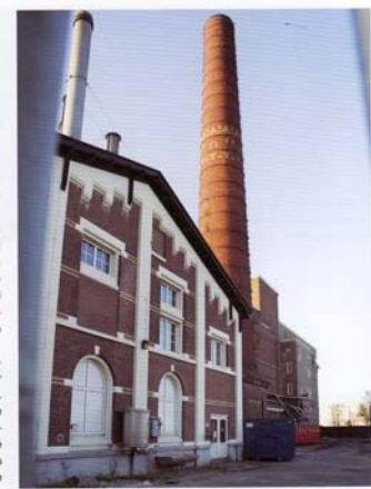
De schoorsteen met de drie hoefijzers prominent in beeld

De Rijksmonumenten Brouwhuis, Machinekamer, Ketelhuis en de Schoorsteen