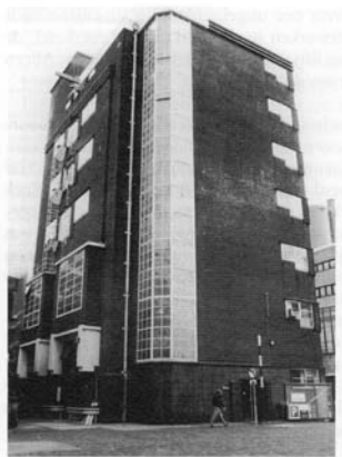
Het brouwhuis uit 1930

zijn aangekocht door T.T.R.R., projectontwikkelaar in Breda. Het plan voor herbestemming, dat in het voorjaar in samenwerking met Amstelland gepresenteerd zou worden, loopt vertraging op vanwege de nog niet afgegeven benodigde vergunningen.