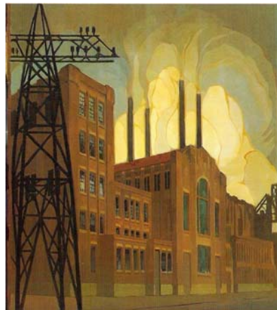
A. Verhorst 1922, Dongecentrale

De provincie Noord-Brabant heeft per 1 januari 2012 de Dongecentrale van Essent gekocht. Het is de bedoeling dat zij, in samenwerking met BOEI (Nationale maatschappij tot behoud, ontwikkeling en exploitatie van industrieel erfgoed) de centrale en het filtergebouw herontwikkelen.