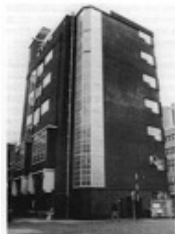
Lichtschaft van het Brouwhuis

ambitieuze plannen die zij hebben met het voormalige Brouwhuis in de Cerresstraat in Breda. Met name worden hier de prachtige glas-in-loodramen van de lichtschaft genoemd. Deze schacht werd gebruikt om volle flessen vanuit de bottelarij (op de zolder van de mouterij) naar beneden te transporteren. De ontwikkelaar hoopt de eerste ruimte eind 2013 in gebruik te kunnen nemen.