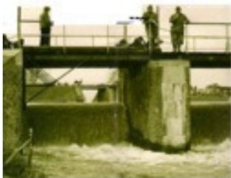
Sluis Fort Everdingen

De Brie gaf acte de présence bij een inspraakavond van de Gemeente Halderberge (Oudenbosch, Oud-Gastel, Stampersgat, Standaard Buiten, Hoeven en Bosschenhoofd) inzake de nieuwe structuurvisie 2012-2015. Aanleiding was de toekomstige herbesteding van de Suikerfabriek St. Antoine te Stampersgat . Een extern architectenbureau is ingeschakeld om te adviseren, maar omdat dit bureau weinig weet over wat er zich in feite afspeelt, probeerden zij, door middel van een discussie tussen de aanwezigen, kennis te vergaren over dit project. De BrIE verzond een brief aan B&W om in overweging te nemen om de locatie St. Antoinedijk in Oud-Gastel in de op te stellen structuurvisie Halderberge op te nemen. Hierop is door B&W eind augustus 2012 positief gereageerd. Dit zou betekenen dat er een economische impuls gegeven kan worden aan de Gemeente Halderberge.