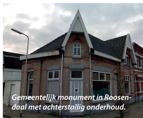
Gemeentelijk monument in Roosendaal met achterstallig onderhoud.

Vanwege de geconstateerde gebreken gaat Monumentenhuis Brabant een ondersteuningsstructuur voor gemeenten met betrekking tot toezicht en handhaving van alle monu-