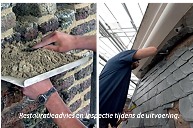
Restauratieadvies en inspectie tijdens de uitvoering.