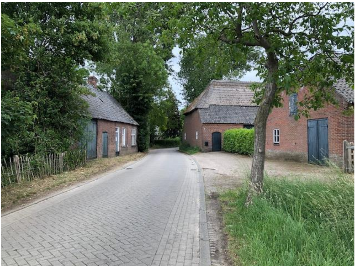
Project 'Cultuurhistorisch waardevolle buurtschappen in Het Groene Woud', dat is uitgevoerd in samenwerking met lokale heemkundeverenigingen. Op de foto buurtschap Flaas in Den Dungen.

Belangrijke partners van Monumentenhuis Brabant in dit verband zijn lokale heemkunde-verenigingen, dorpsraden en buurtcomités. Bij planontwikkeling waar leefbaarheid en sociale cohesie aan de orde is, gaan wij te rade bij de Vereniging Kleine Kernen of ZET.